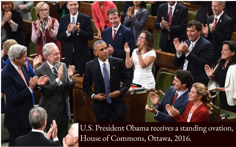
U.S. President Obama receives a standing ovation, House of Commons, Ottawa, 2016.

Dans la Rome antique, les grandes victoires militaires étaient célébrées par des défilés de triomphe sous un arc de triomphe (ill.).