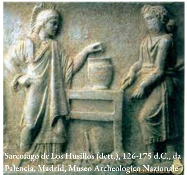
Sarcofago de Los Husillos (dett.), 126-175 d.C., da Palencia, Madrid, Museo Archeologico Nazionale

Now the delegitimized Erinyes compromise by transforming themselves into Eumenides (the Kindly Ones).